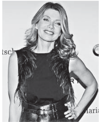
■ Fashion-Week-Gast Ursula Karven . FOTO: B. PEDERSEN

Er ist eine lebende Legende: Placido Domingo . Zu